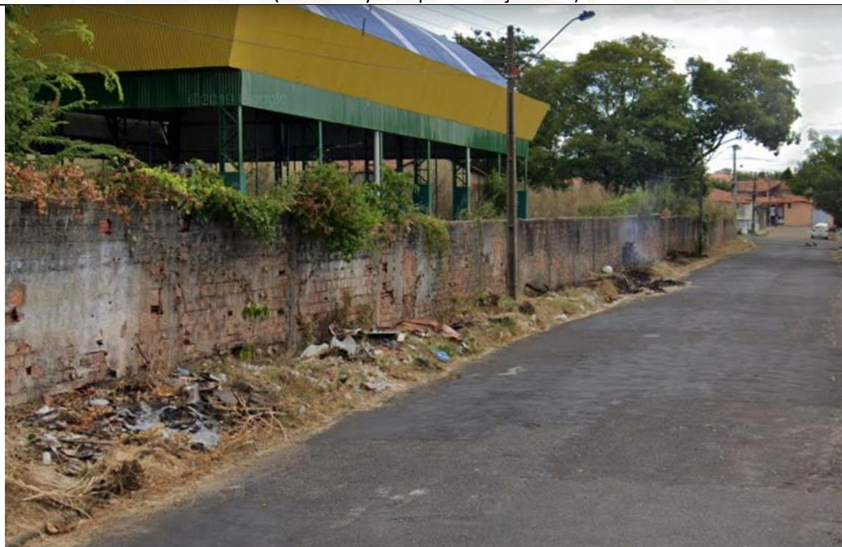
Figura 06: Vista do entorno da escola sem calçada e muito entulho. (Foto: Tallyta Lopes –março 2021)