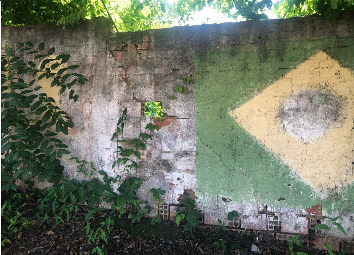
Figura 03: Vista das rachaduras no muro. (Foto: Tallyta Lopes –março 2021)