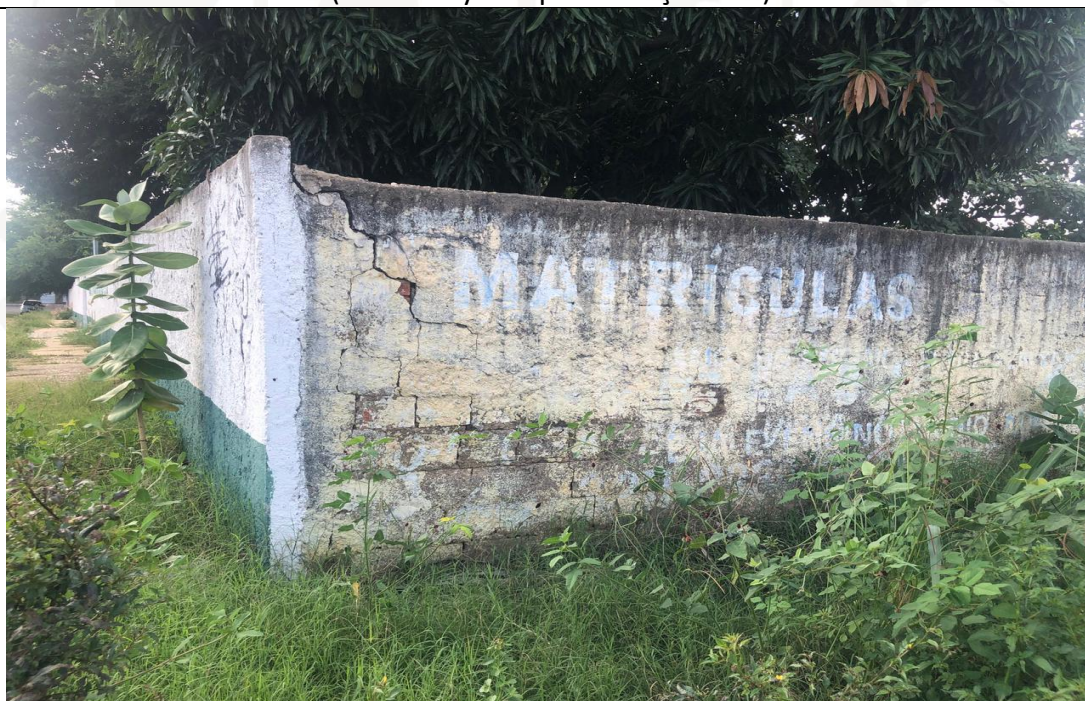
Figura 02: Vista das rachaduras no muro. (Foto: Tallyta Lopes –março 2021)