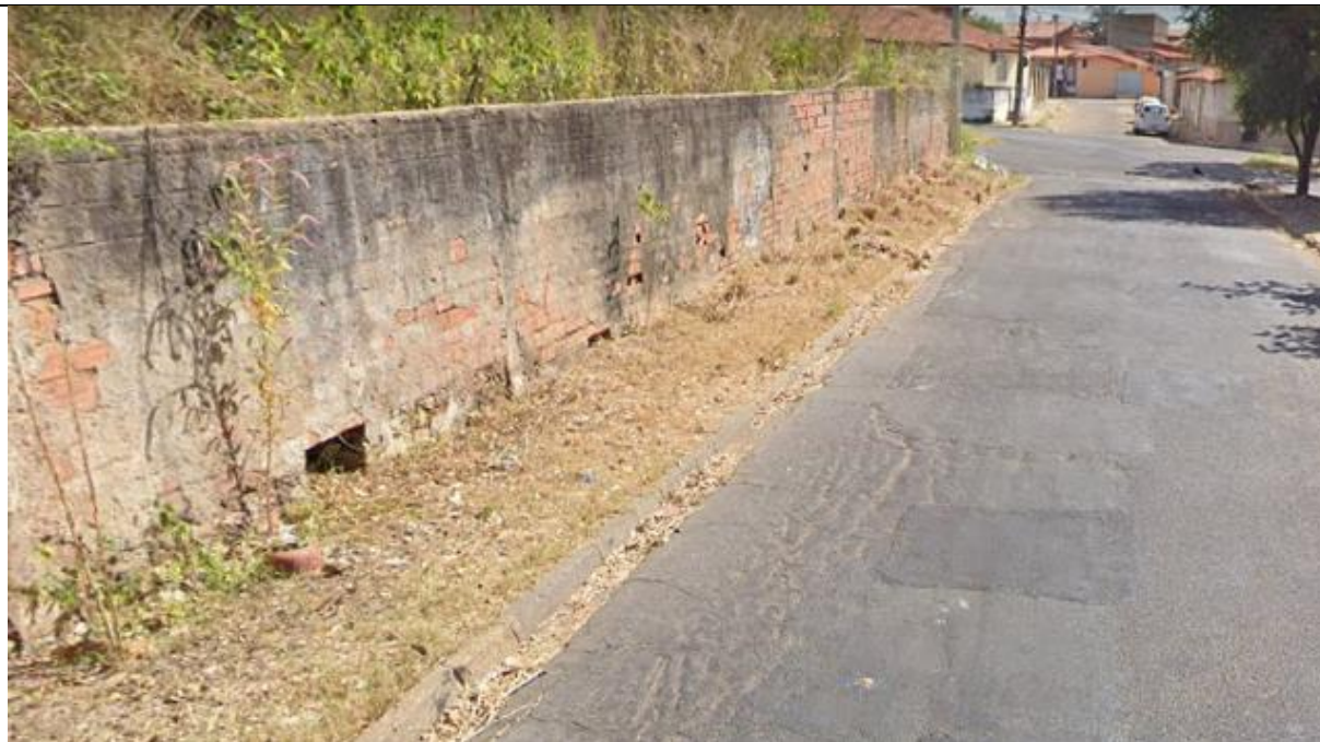
Figura 05: Vista do entorno da escola sem calçada e muito entulho. (Foto: Tallyta Lopes –março 2021)

Atesto que a calçada e o muro da edificação estão em estado ruim, sendo necessário a reforma imediata do muro, uma vez que o mesmo está na iminência de desabar, ainda mais no atual período chuvoso. A intervenção será no perímetro do fundo, lateral esquerda e parte do muro da lateral direita da Unidade Escolar João Emílio Falcão, além da reforma da calçada.