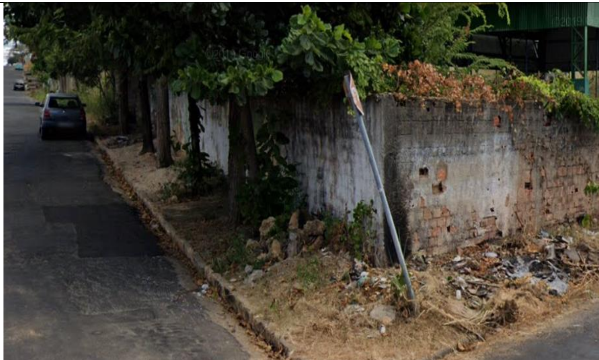
Figura 05: Vista do entulho na calçada. (março 2021)