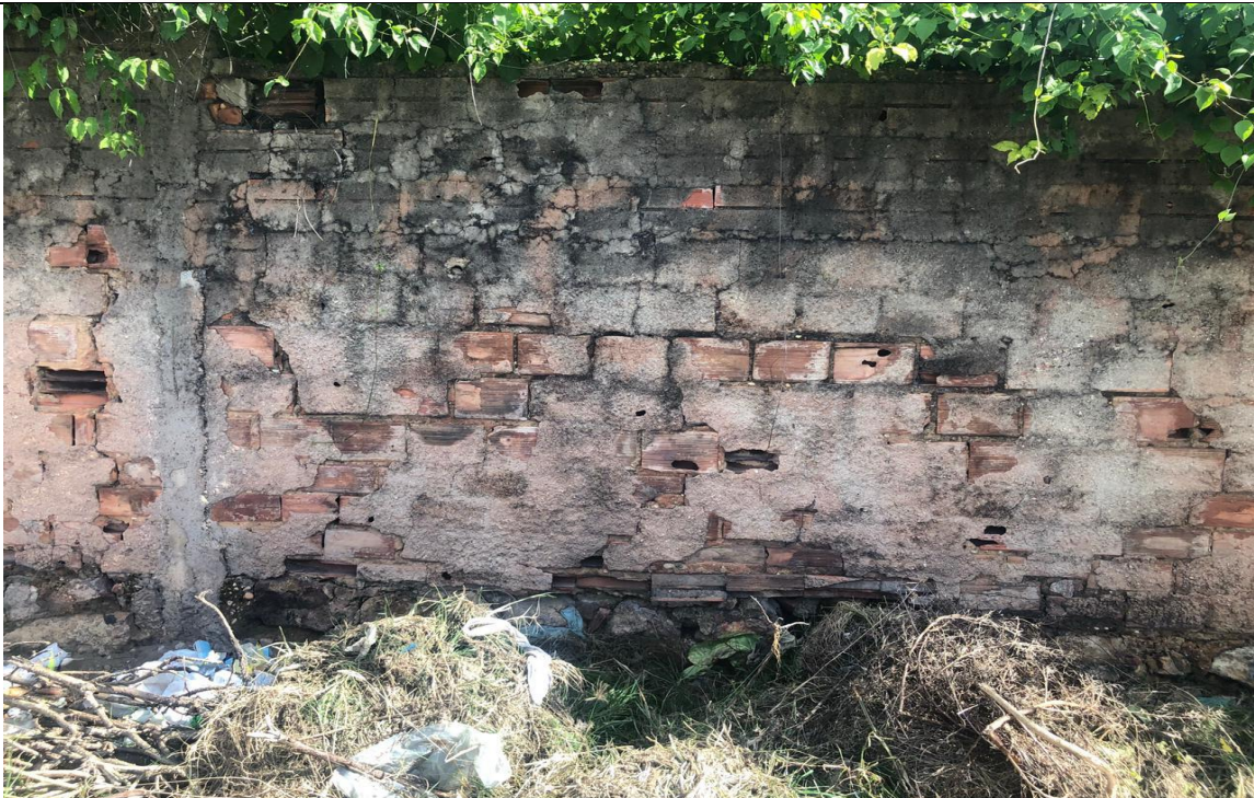
Figura 04: Vista da erosão da fundação em pedra argamassada. (Foto: Tallyta Lopes –março 2021)